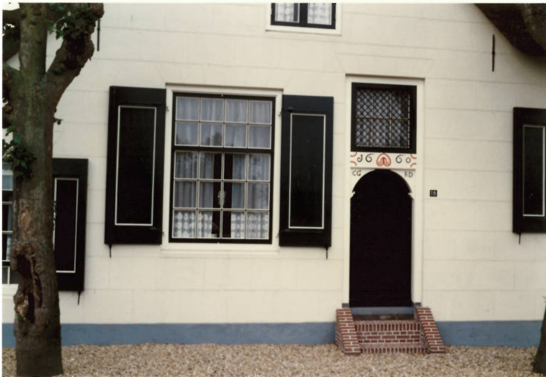
CG RD boven de deur is de naam van de bouwer C. G. de Ridder Bij de restauratie is er een plaatje gevonden met het jaar 1660.