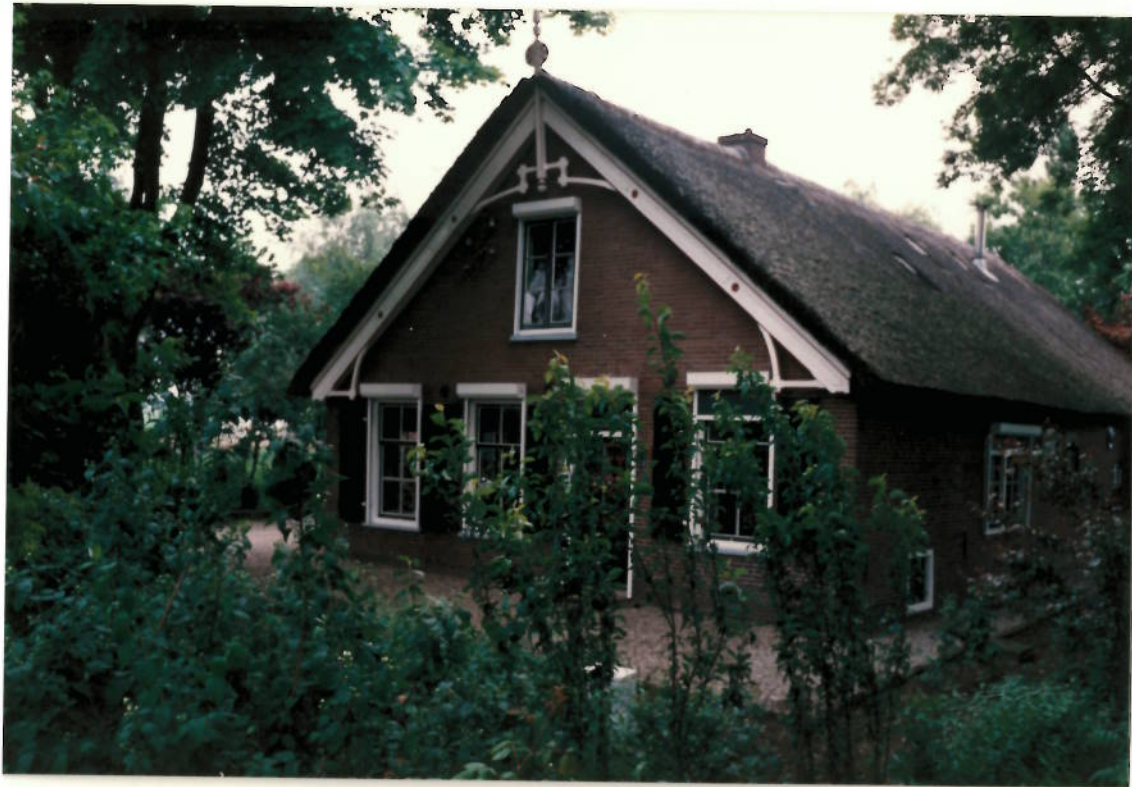
Westvlietdijk 40 De Vlist